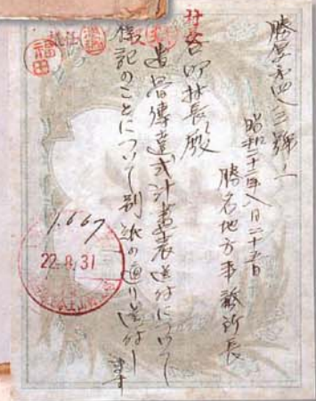
▲ラベルの裏面を活用した公文書