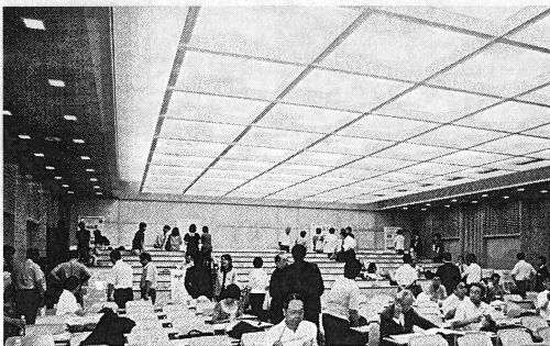
ポスター報告の様子

このほか、8本のポスターが会場に設置された。これは、科研費研究に補助員として参加している京都府内の大学院生がそれぞれの成果をポスターにまとめたものである。